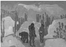
Pedro Figari La idea del crimen Óleo sobre cartón, sin fecha 98 x 66, 5 cm Colección Museo Histórico Nacional