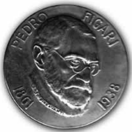
Medalla conmemorativa en el Centenario del nacimiento de Pedro Figari. Buenos Aires, 1961.