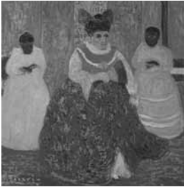
Pedro Figari Dama antigua Óleo sobre cartón, sin fecha 51 x 51 cm Colección Museo Histórico Nacional