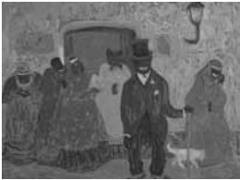
Pedro Figari Viejo verde Óleo sobre cartón, sin fecha 81 x 61 cm Colección Museo Histórico Nacional