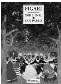
Figari XXIII Bienal de San Pablo. Montevideo, 1996.