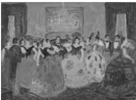
Pedro Figari En sociedad Óleo sobre cartón, sin fecha 70 x 51 cm Colección Museo Histórico Nacional