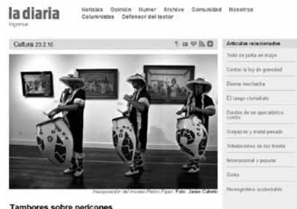
Tambores sobre pericones Qué tal funcionando el Museo Figari.