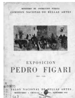
Exposición Pedro Figari 1861-1938 . Comisión Nacional de Bellas Artes. Teatro Solís. Montevideo, 1945.