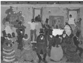
Pedro Figari Candombe Óleo sobre cartón, sin fecha 81 x 61 cm Colección Museo Histórico Nacional