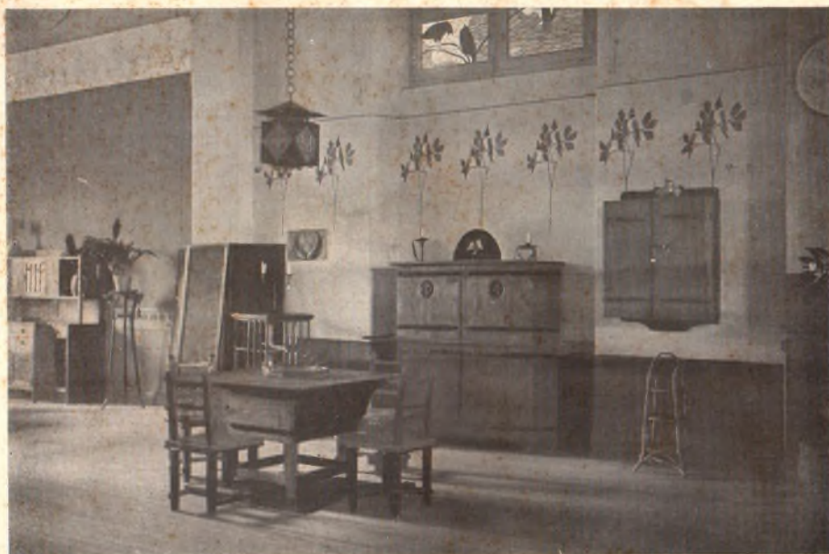
Exposición de fin de cursos. — 1916