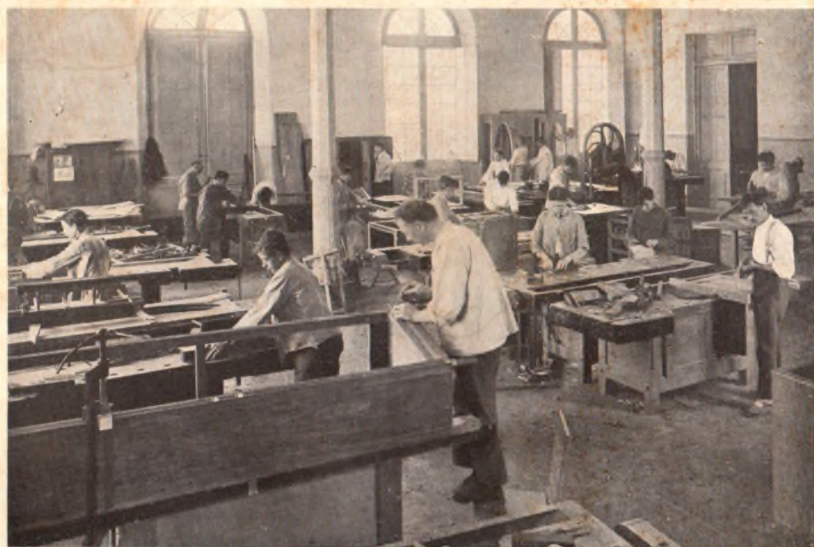
Arriba: Herrería Artística . — Abajo: Mueblería y Carpintería .