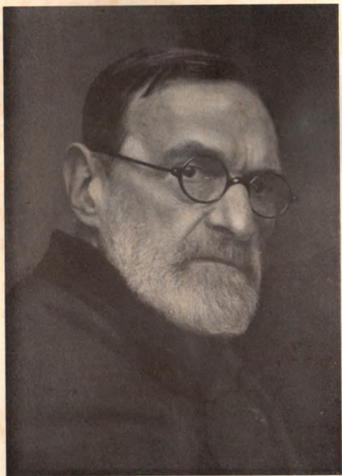
DR. PEDRO FIGARI