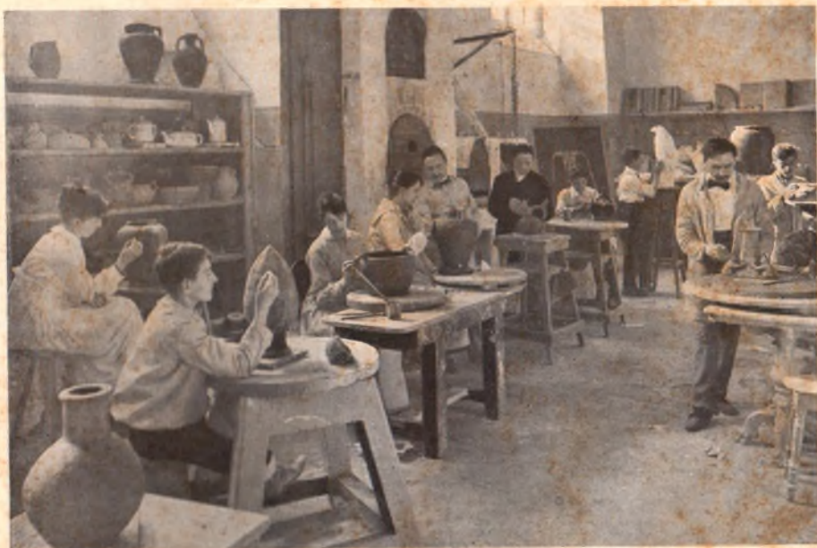
Arriba: Clase de Bordados. — Abajo: Modelado y Cerámica.